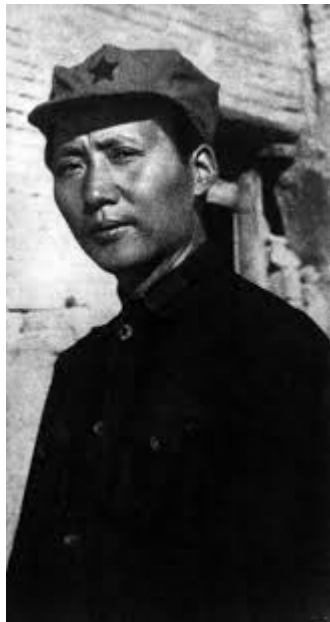
Xi Jinping, 2012.11