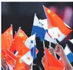
AFP | Embajada de la República Popular China y Panamá

Entrevista con Tapelí, TAIWÁN. Cuatro años después de establecidas las relaciones diplomáticas entre Panamá y la República Popular China, el tema de China ha dejado de ser un tabú para los distintos sectores de la sociedad panameña, y poco a poco se ha perdido el miedo a discurrir del adscribimiento impuesto por la clase política de nuestro país, y la