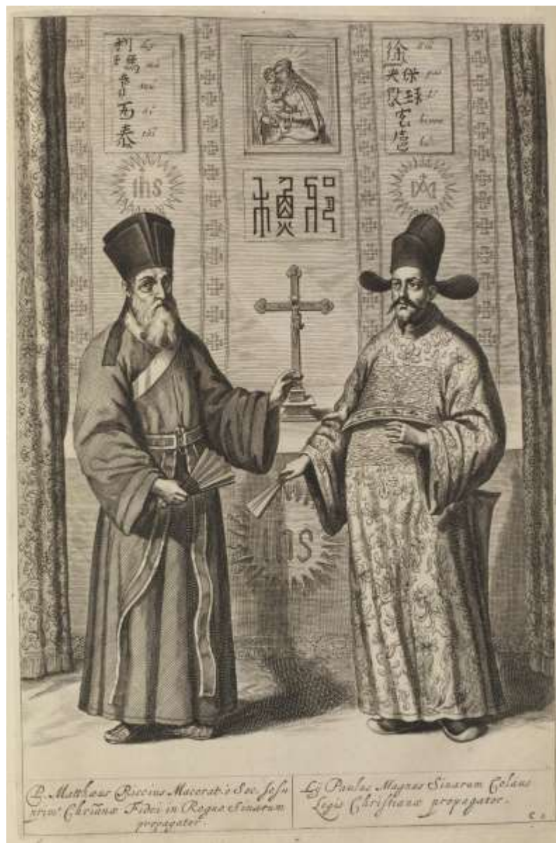
P. Mathaeus Riccius. Macaroti's Soc. Jesu viri Christianae Fidei in Regna et Imperium propagator.